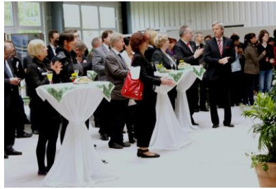
Unsere Gäste bei der Veranstaltung „20 Jahre SUFW Dresden e. V.“.

Das Berufsorientierungszentrum des SUFW Dresden e. V. wird nach der Sanierung des Hauses III festlich eröffnet. Damit wird das Angebot an Berufsfeldern in der Berufsorientierung um Elektrotechnik, Kfz-Technik und Floristik erweitert.