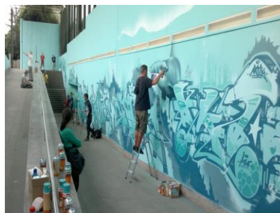
Gestaltung des Fußgängertunnels in Gorbitz.