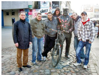
Unsere AVDD-Lehrlinge zum Auslandspraktikum in Polen.