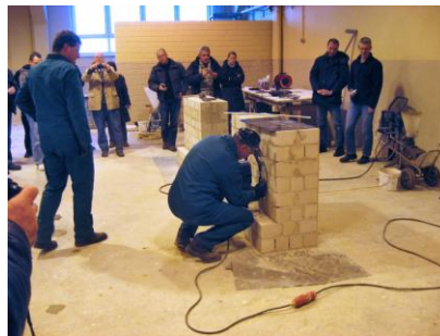
Durchführung eines zweitägigen Studienkurses für die Fachfortbildung „Sachverständiger für Bautenschutz und Bausanierung“ der Firma EIPOS im SUFW Dresden e. V.