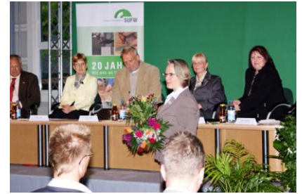
Unternehmerstammtisch zum 20jährigen Bestehen des SUFW Dresden e. V.