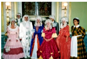
Der Hofstaat vom SUFW feiert im Schloss Albrechtsberg einen Ball. Gräfin Cosel sowie das Orchester „concertus vocum“ entführen uns in die Zeit des Barock.