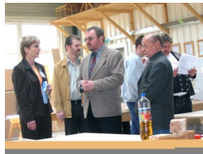
Tag der offenen Tür im Bauzentrum