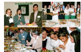
120 Gäste des DPJW besuchen das SUFW und finden in der umfunktionierten Mauerhalle Platz.