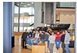
Deutsch-slowenisches Leonardo Projekt Maschinenbautechniker aus Novo Mesto (Slowenien) absolvieren im Rahmen ihrer Ausbildung ein Praktikum im BZ Metall.