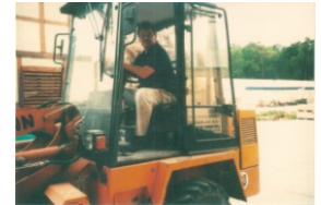
Überbetriebliche Ausbildung in den verschiedensten Baugewerken