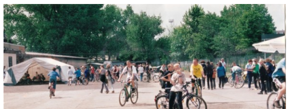
Auf einer 12000 m 2 großen Fläche an der Muegeln Straße entsteht eine Cross- und Trailstrecke, auf welcher Jugendliche eigene Möglichkeiten und Grenzen beim Führen von Kfz auf einer nicht öffentlichen Strecke unter fachlicher Anleitung und sozialpädagogischer Betreuung austesten können.

Das SUFW wird als Träger der Freien Jugendhilfe anerkannt.