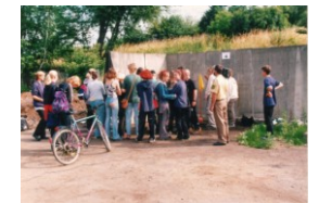
Verkehrsunterricht nach richtiger Auflage: Diese Maßnahme dient der Sensibilisierung von Jugendlichen, die erstmalig oder wiederholt Straftaten im Verkehrsbereich begangen haben, sich mit ihrem Verhalten im Straßenverkehr aktiv und kritisch auseinander zu setzen.

In der Verwaltung des SUFW wird der erste eigene Lehrling zur Bürokauffrau ausgebildet.