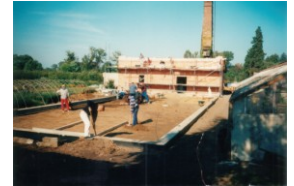
Aus Alt mach Neu - Lehrlinge und Ausbilder gestalten aus der alten Gärtnerei eine moderne Ausbildungsstätte für den Garten- und Landschaftsbau.